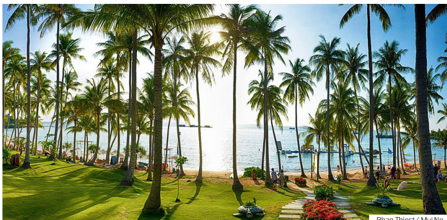
Phan Thiet / Mui Ne

zu können. Wir erreichen die Insel Tân Phong, um auf Dorfwegen zu radeln und das örtliche Alltagsleben kennenzulernen. Auf Ihrer Tour passieren Sie Obstgärten, eine Schule, eine Kirche, Pagoden und traditionelle Häuser. Unterwegs können wir einige Stopps einlegen, um zu sehen, wie aus der getrockneten Wasserhyazinthe viele lokale Produkte wie Körbe, Taschen, Hüte, Geldbörsen oder Schuhe hergestellt werden.